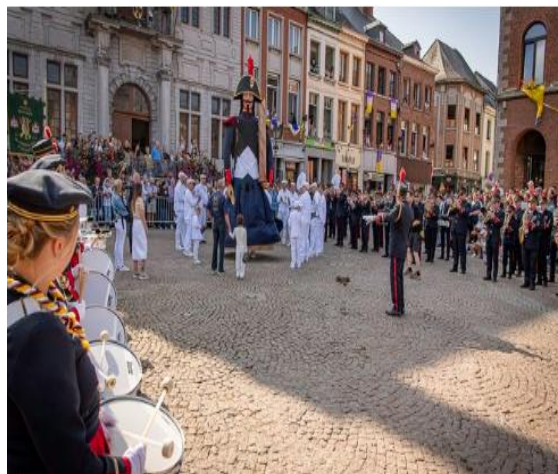
Le quatrième dimanche d'août

Le tout se terminant par une dégustation du breuvage. Plus d'infos via www.visitath.be .