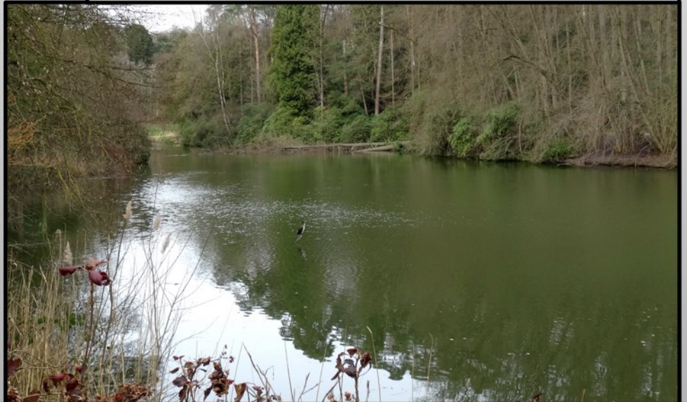
L'ENDROIT EST SPLENDIDE, LA NATURE EST GÉNIALE !