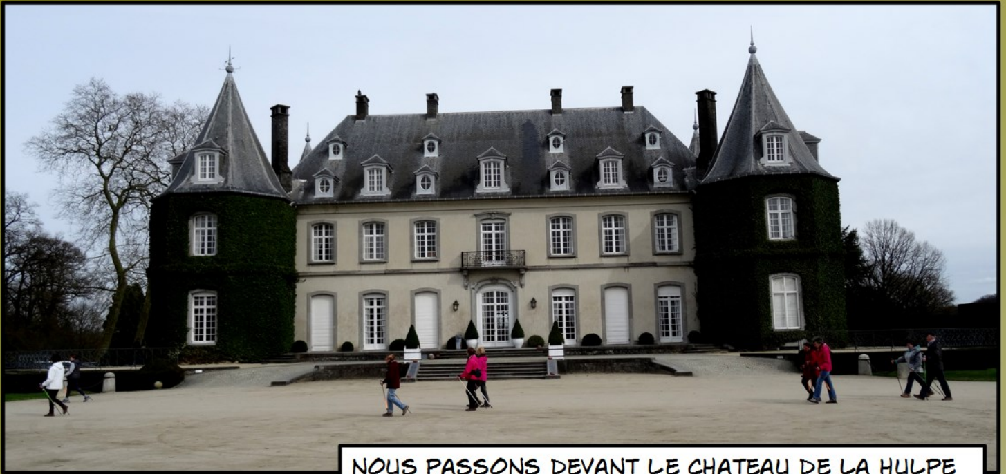
NOUS PASSONS DEVANT LE CHATEAU DE LA HULPE