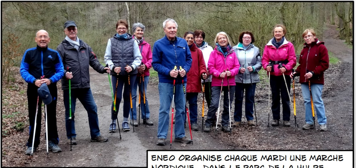
ENE0 ORGANISE CHAQUE MARDI UNE MARCHÉ NORDIQUE, DANS LE PARC DE LA HULPE.