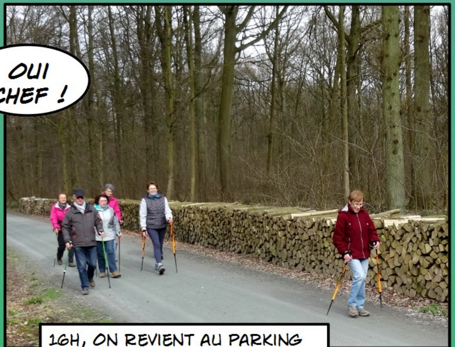
16H, ON REVIENT AU PARKING