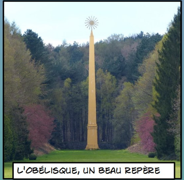
L'OBÉLISQUE, UN BEAU REPÈRE