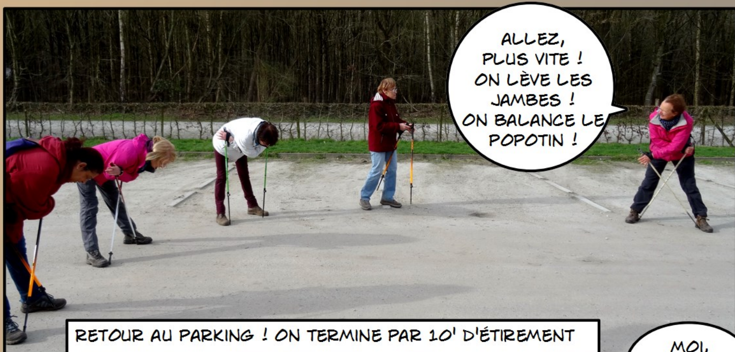
RETOUR AU PARKING ! ON TERMINE PAR 10' D'ÉTIREMENT