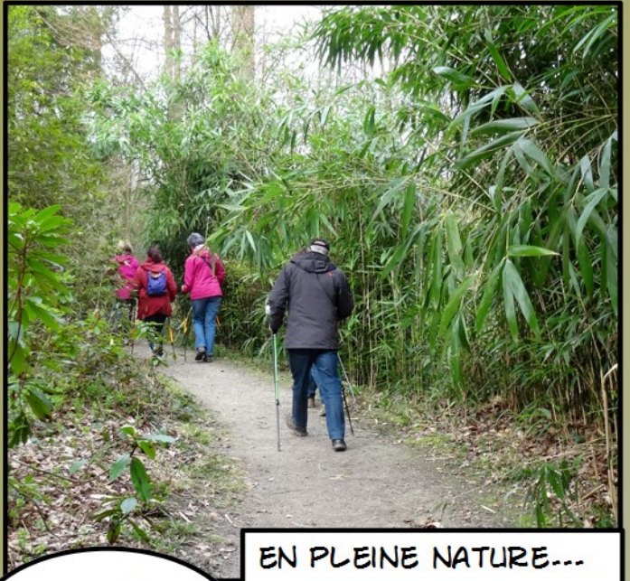
EN PLEINE NATURE...