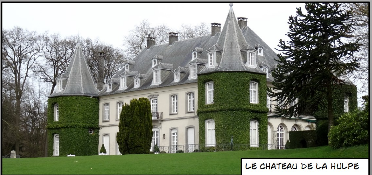
LE CHATEAU DE LA HULPE